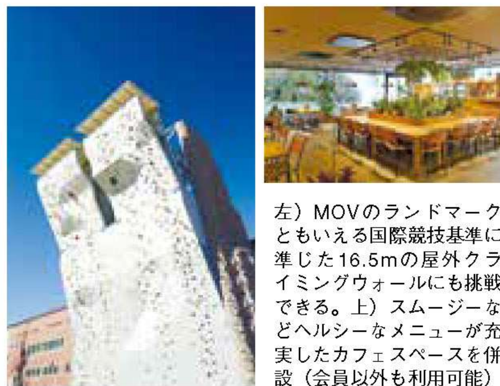
左) MOVのランドマークともいえる国際競技基準に準じた16.5mの屋外クライミングウォールにも挑戦できる。上) スムージーなどヘルシーなメニューが充実したカフェスペースを併設(会員以外も利用可能)

オリンピックの正式種目にも採用され注目が集まるクライミング、身体と心のメンテナンスにピッタリなヨガが体験できるPLAY。開放感あふれるヨガスタジオ、また、クライミングもレベルの異なるさまざまなウォールが用意されており、楽しむには最高の環境です。この春は登録料、さらには入会月の月会費が無料になるキャンペーンを実施。ぜひこの機会に体験してみたいはかがでしょうか。