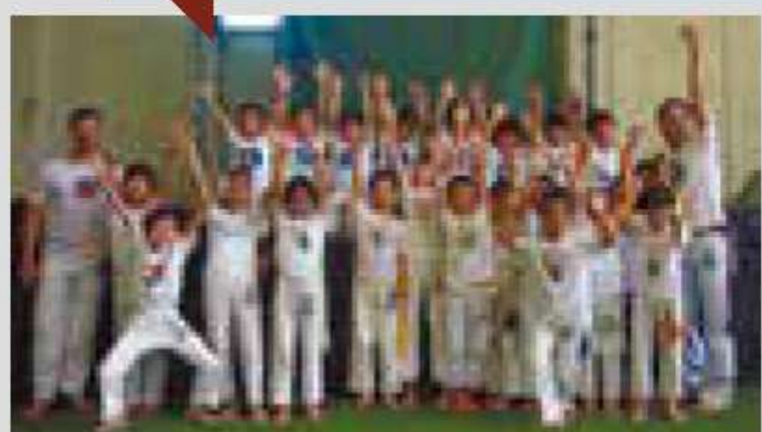
格闘技と音楽やダンスの要素を組み合わせたカポエイラのキッズスクールがスタート! 17~18時(毎週金曜)。定員10名(先着順)。¥6,750