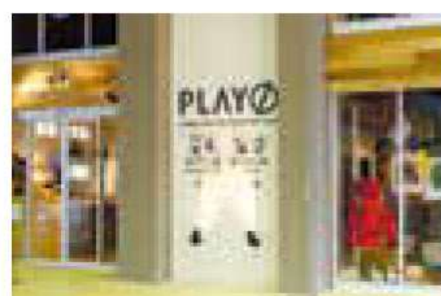
ヨガだけでなくクライミングのスクールも充実。学校帰りに通える子ども向けの講習も用意