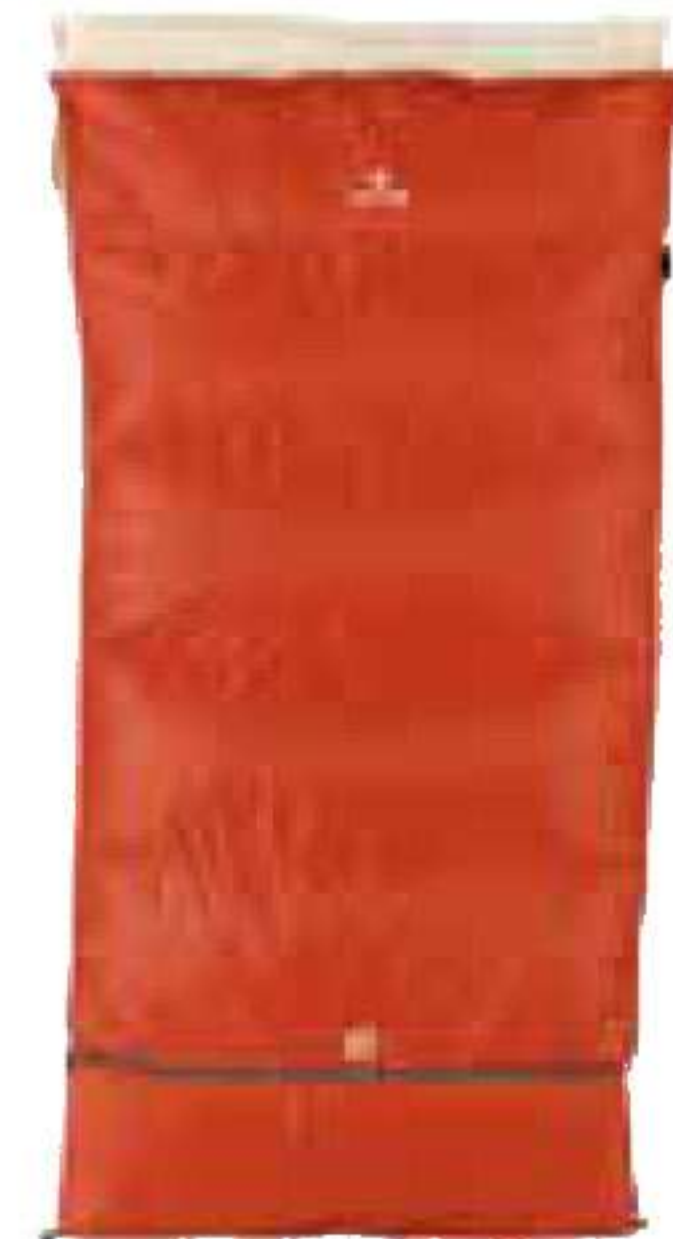
スノーピーク/ セバレットシュラフ ソフトワイドDLX

2枚の竹製天板を開けば、中から脚が出てすぐに設営できます。天板高は使いやすい66cmに設定。他に2モデルあり。¥27,800 C