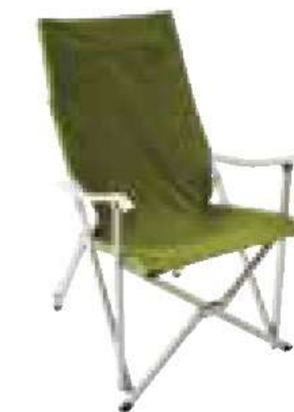
アディロンダック/ キャンパスチェア

大判のハンモック。1人用ですが、2人でも利用可能。スタンドやロープなどオプションも充実! ¥14,800 A