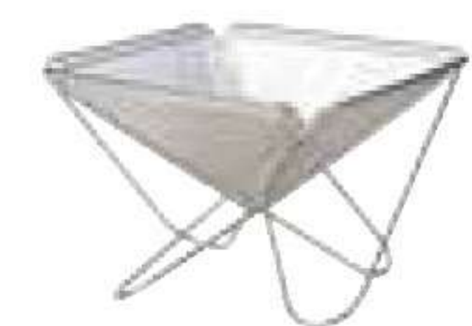
スノーピーク/ 焚火台M

シンプルな開閉機構で、折り畳めば平らにして持ち運ぶことが可能。オプションを使えばさまざまな料理を作ること。¥12,600 C