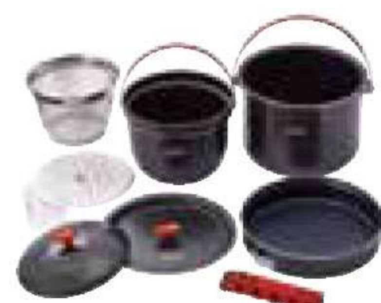
コールマン/ アルミクッカーコンボ

USBポートが付いたLEDランタン。取り外し可能な発光パネルが4面に付き、それぞれ単独で使用できます。¥9,800 C