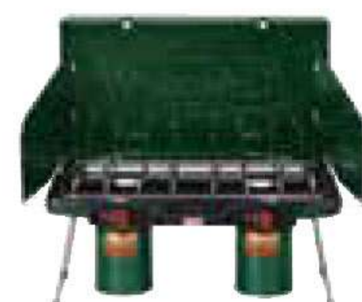
コールマン/ パワーハウスLP ツーパーナーストーブ

ザルなどが付いたクッカーセット。ノンスティック加工で焦げ付きを防止。ポットに全アイテムが収納可能。¥13,800 C