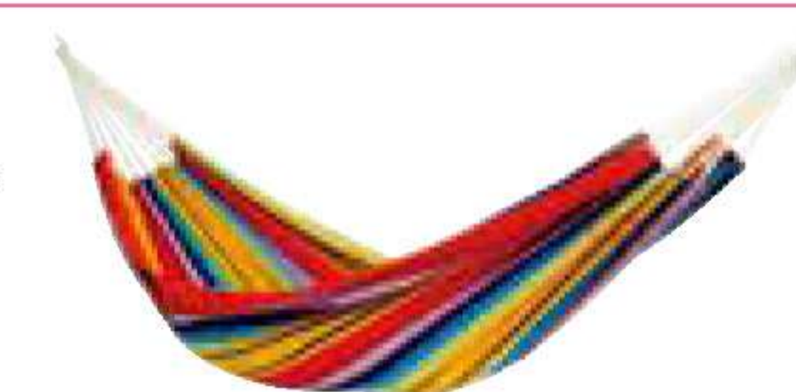
バイヤーオブメイン/ バルバドスハンモック

大判のハンモック。1人用ですが、2人でも利用可能。スタンドやロープなどオプションも充実! ¥14,800 A