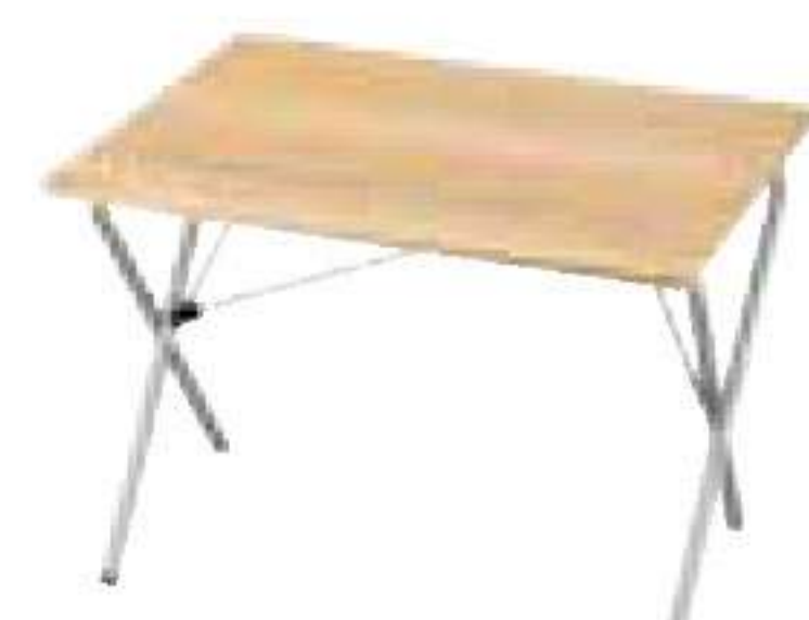
スノーピーク/ ワン アクションテーブル竹

シンプルな開閉機構で、折り畳めば平らにして持ち運ぶことが可能。オプションを使えばさまざまな料理を作ること。¥12,600 C