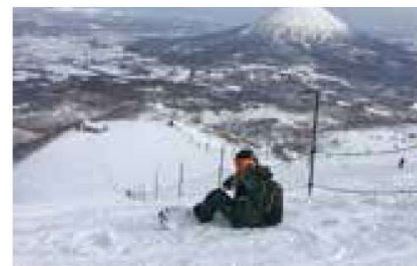
憧れのニセコにて。雪質はもちろん、山からの壮大な風景も魅力。右奥に見えるのは羊蹄山