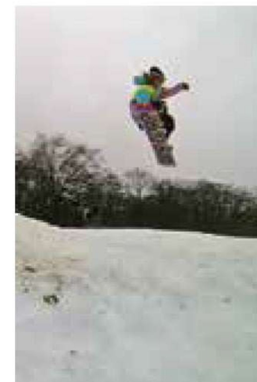
オフィシャルは反発力に優れているので、苦手なオーリーもこの通りバッチリ。パークで遊び倒すのにも向いているボードだ

なアクションもしやすいんです。おかげで、どんなシーンでも快適に滑ることができました。