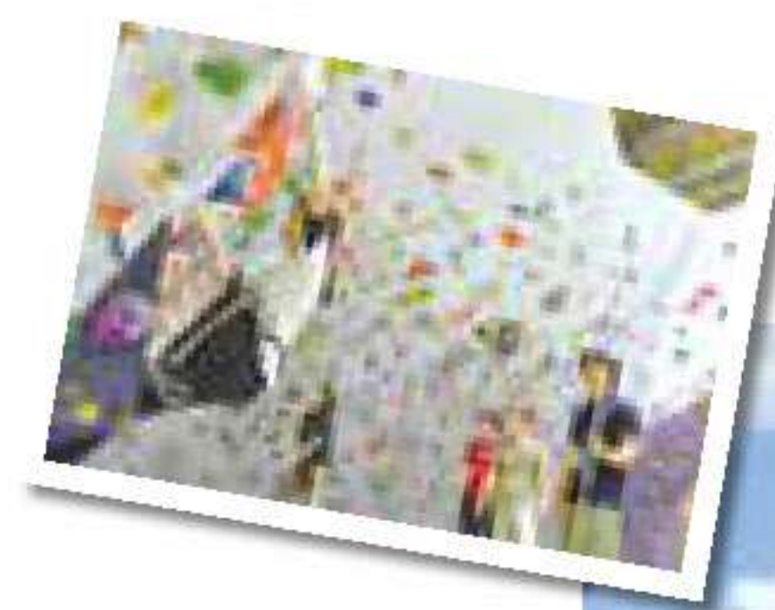
PLAYではボルダリングやリードも体験できる新プログラムを実施！ビギナーも大歓迎だそう