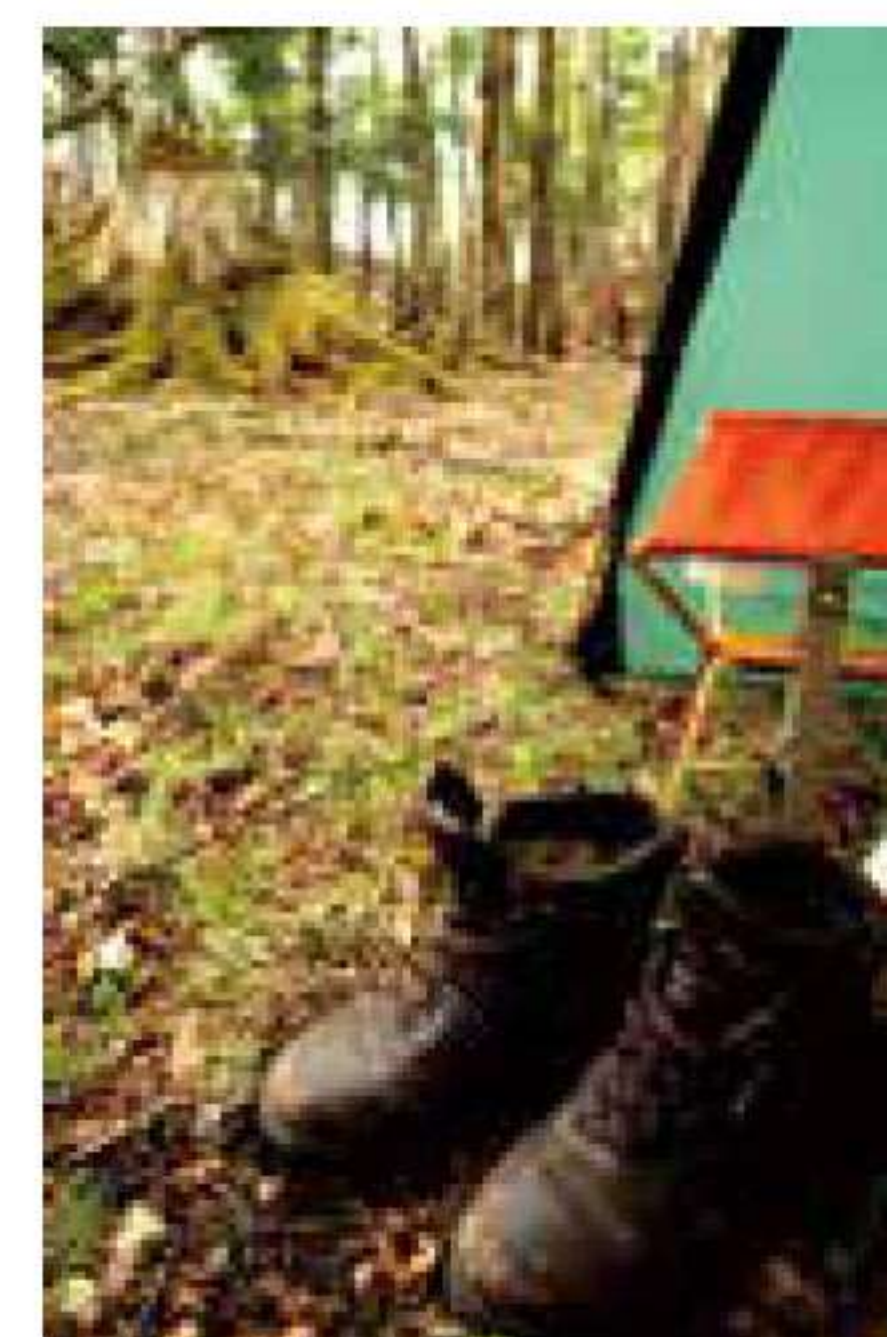
上) 屋久島では運よく天気にも恵まれた。下) こちらも愛用中のバスクのサンダウナーとアディロンダックのチェア

広い店舗でアメリカを中心とした多数のアウトドアブランドのアイテムを展開。とくにバックパック、キャンプギア、キッズアイテムなどが豊富で、ファミリーでも楽しめるショップ。SUPのボードなども展示しているので要チェック