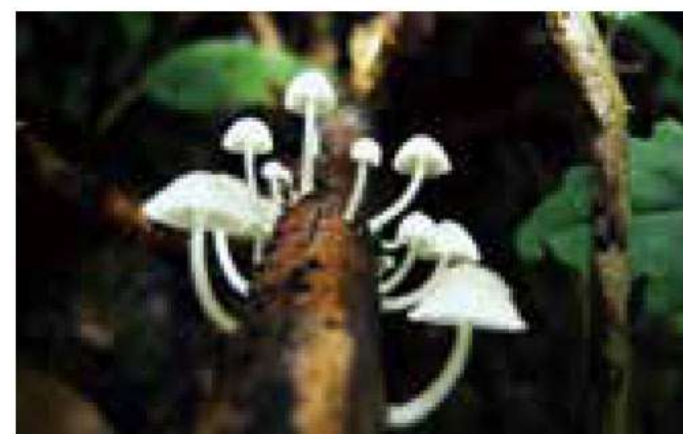
キノコを観察するのが至福のとき。地を這うような姿になっていて変な人と思われることも…

このパリセードとともに各地のフィールドに行きましたが、一番思い出深いのは2008年に行った屋久島です。2泊3日で白谷雲水峡からヤクスギランドまで縦走したのですが、その目的はまだ見ぬキノコに出会い、写真に収めること。カメラ、三脚、キノコ図鑑など、いつもより余計に荷物を詰め込んで、それまでで一番荷物が重くなった山行でした。ですが、腰にしっ