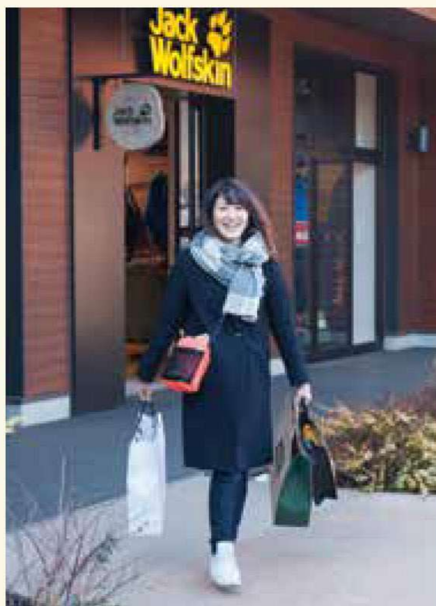
MOVに軒を連ねるアウトドアブランドの直営店は全14店舗。商品を手に取り眺めているだけでもあっという間に楽しく時間が過ぎてしまう