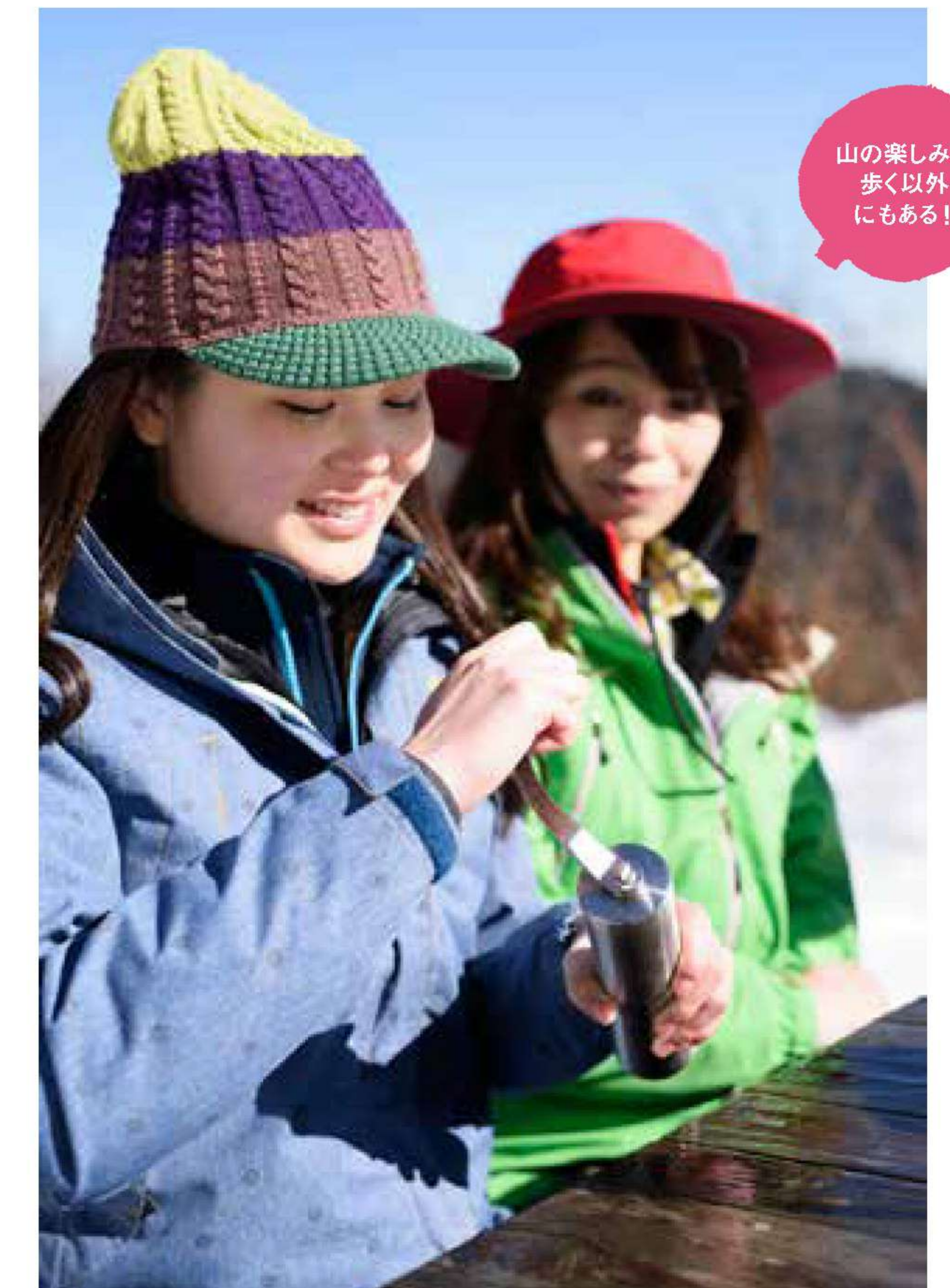
山の楽しみは歩く以外にもある!