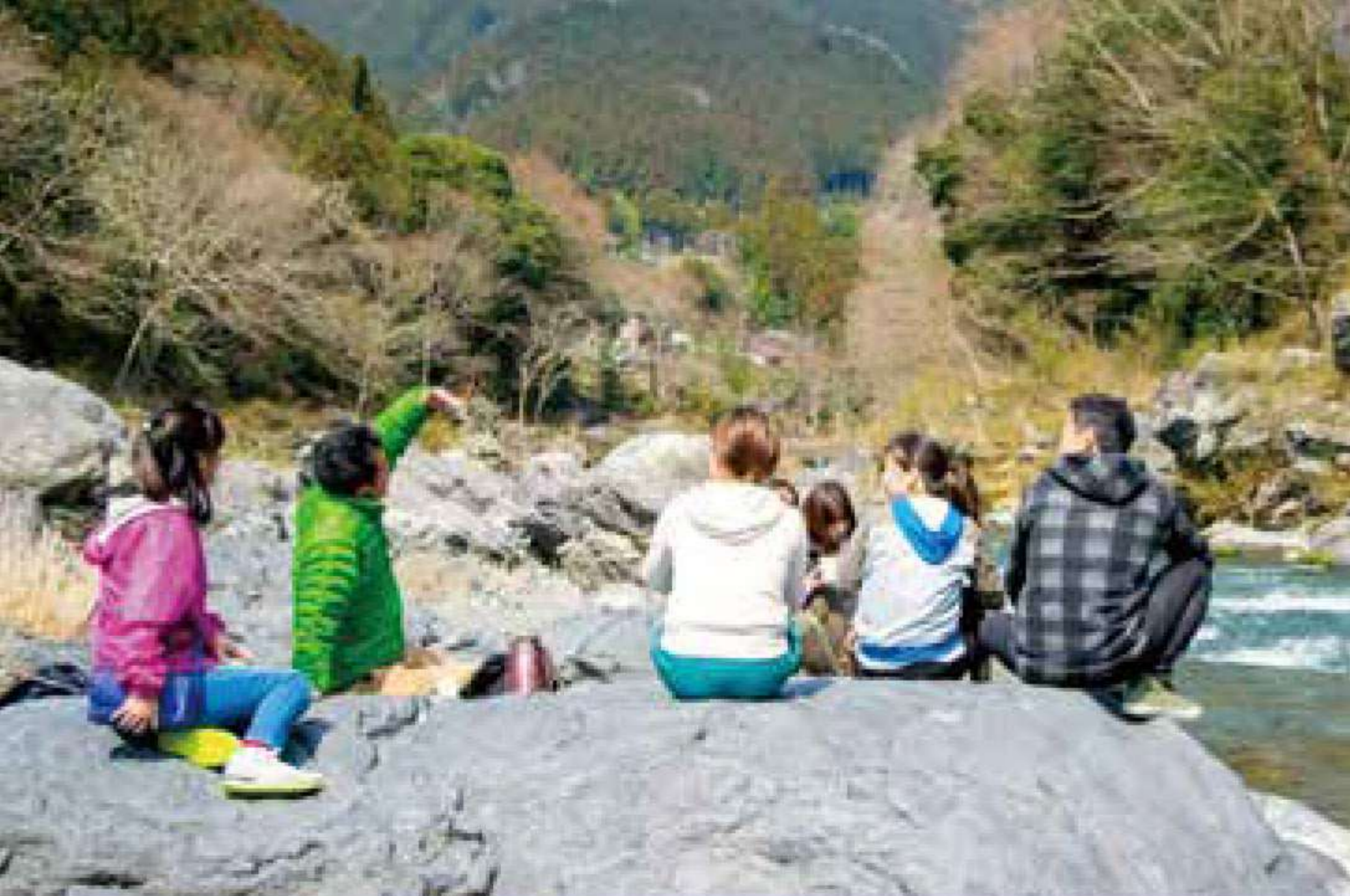
森の演出家が行なう独自の「五感セラピー」は人と自然との対話だ