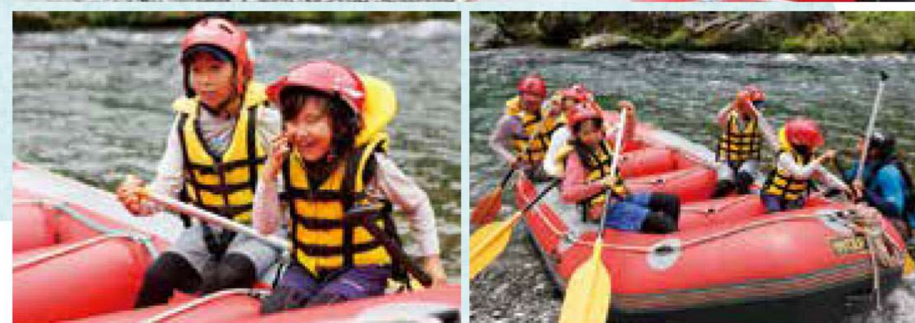
最初は不安げだった子どもたちも河原に出て練習を始めると徐々に笑顔が見えてきた