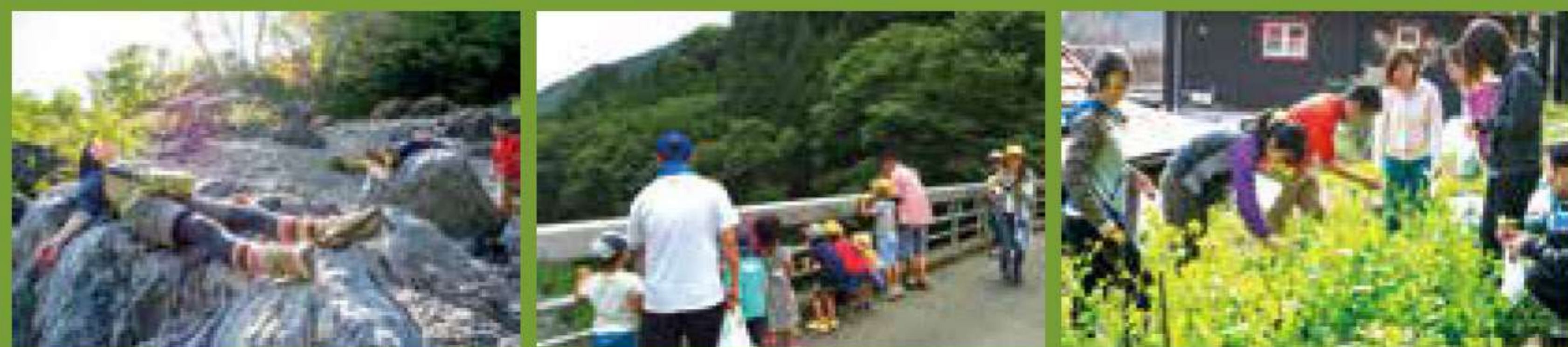
右) 人は日常から食を通じて自然とつながっている。中) 自然は子どもたちの最高の プレイグラウンドだ。左) 日々の“チカラ”を抜き、心身を休める時間を持つ

かさ”を体感していただくサー ビスを提供しています。 そのサービスは3つの理念に 基づいています。 ひとつ目は「森育」。風に枝 を揺らす豊かな木々、山から湧 き出る清らかな水、大地に転がる 石たち……。そんな森のリア ルな表情に触れ、いまこの瞬間 も静かに生き続ける森と話をす る時間を作ります。