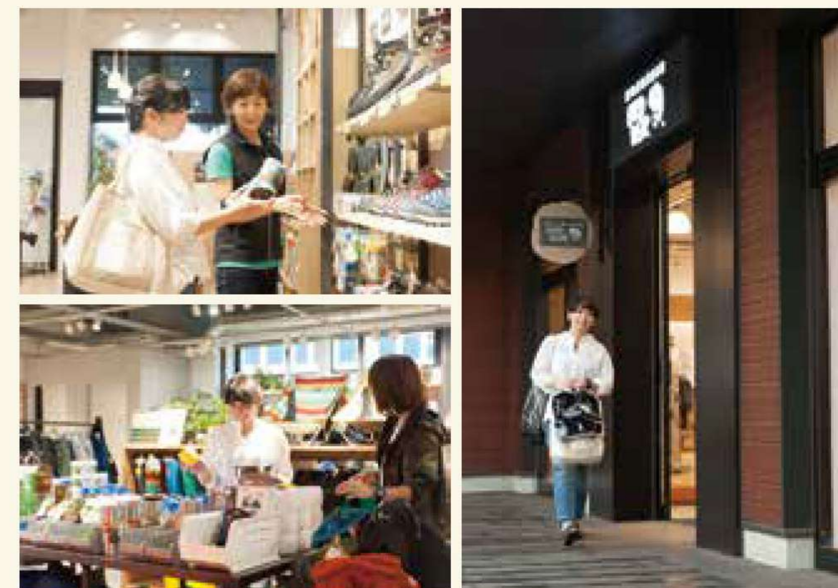
予算ピッタリをめざして悩み抜いた結果、お買い物総額は税込みで¥49,788! 我ながらじつにいい買い物をしたと思う

。買い物で悩んだら、併設のカフェで甘いスイーツをいただきながら一息つくのもいい。 予算の都合上、バックパックやレインウエア等は含められなかったが、これをベースにして、行きたい山に必要なスペックのアイテムを買い足せば、さまざまな山を楽しむことができると思う。 山に親しみ、山の恩恵に感謝する。山の日、ともだちを誘って山を歩きに出かけよう!