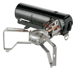
スノーピーク/ HOME&CAMP バーナー