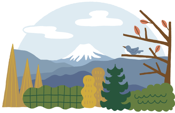
Illustration by M.Takahashi