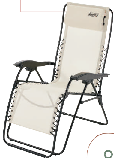
コールマン/ インフィニティチェア (デザートサンド)

寒いなか遠出しなくても手軽に外気分が味わえる「おうちキャンプ」。必要以上に飾り立てる必要はないですが、アウトドアギアをリアルに使えば、それだけでムードが高まります。とくに料理関係の道具にこだわるのがおすすめ。