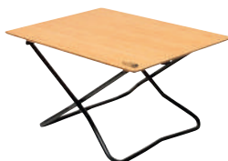
ザ・ノース・フェイス/ TNFキャンプテーブル

フルリクライニングすればベッドのようにリラックスできるぜいたくなチェア。こちらは公式オンライン・昭島店限定カラー/⑤