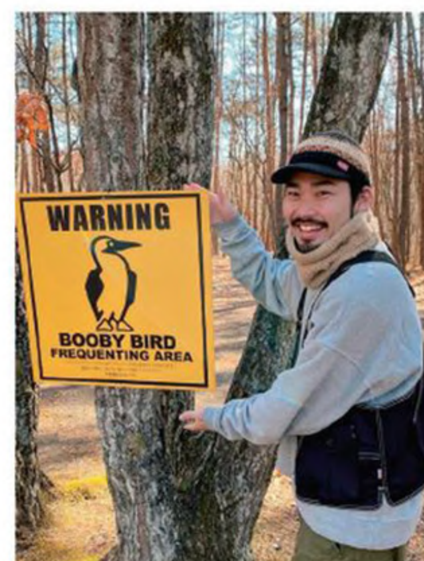
チャムスのロゴマーク「ブービーバード(かつお鳥)」の看板とともに記念撮影(笑)

「なにも考えず“無”になる。そんな時間を求めてキャンプに行っています。本当にただただゆっく